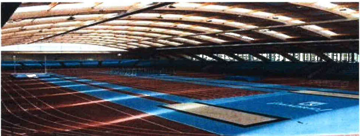
Pabellón Cubierto Gallur